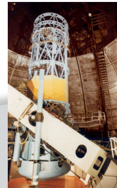
Télescope Hooker de l'observatoire du Mont Wilson avec lequel Edwin Hubble a effectué ses principales découvertes.

Les physiciens ont nommé « année-lumière » la distance parcourue par la lumière dans le vide en une année. Ainsi, une année-lumière correspond à environ 10 000 milliards de kilomètres. Une année-lumière n'est donc pas une unité de temps mais une distance ! Si un extra-terrestre situé sur une planète à 145 millions d'années lumière observait la Terre, il verrait en fait des dinosaures !